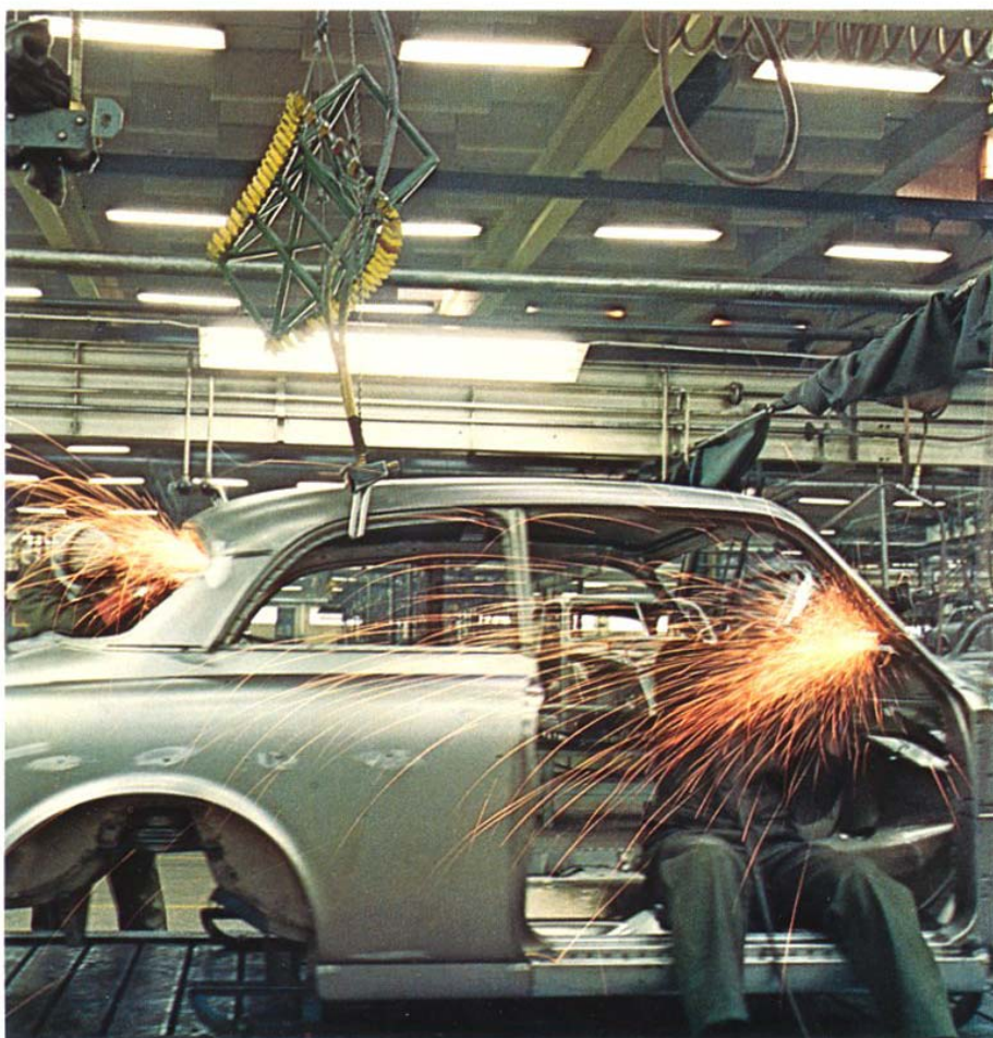
Noggrant underarbete garanterar säkert rostskydd

Varje arbetsmoment följs av en noggrann kontroll. Resultatet blir en seg, hård yta, som håller sin briljans länge.