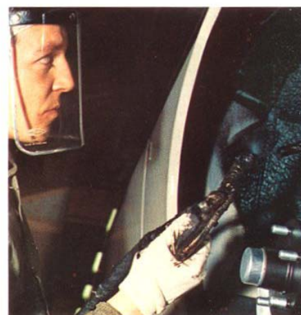
Fullständigt underreddsbehandlad redan i fabriken