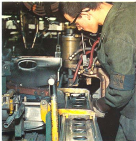
Galvaniserade delar på de mest utsatta ställena

Volvo Amazon har speciellt styv, självbärande kaross. Sittutrymmet erbjuder mycket god säkerhet. Runt varje karossöppning finns extra kraftiga, slutna balkprofiler, en säkerhetsdetalj, där Volvo lett utvecklingen.