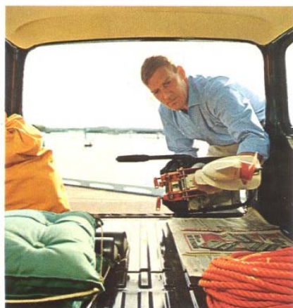
Lätt att lasta — lätt att lossa

Volvo Amazon Herrgårdsvagn har samma eleganta, välplanerade och bekväma inredning som seriens övriga modeller.